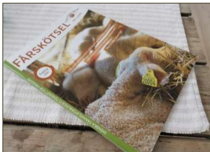
Året med ny kostym på vår medlemstidning Fårskötsel.

Året 2020 var året då vår medlemstidning Fårskötsel bytte utformning och stil. Inför nummer 1-2021 presenterades en ny modern layout av Tidningen Fårskötsel, samt att tidningens papperskvalitet förbättrades till nummer 2. En mycket snygg och uppskattad medlemstidning har blivit verklighet. Tidningen Fårskötsel har publicerat åtta fullmatade nummer, i vilken den fårintresserade hittar mycket läsvärt. Tidningen Fårskötsel är en av medlemskapets många högt uppskattade företeelser.