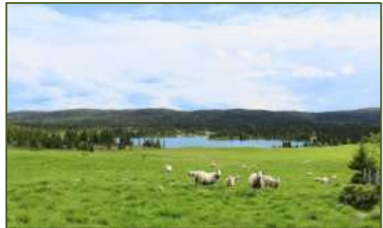
Vi ser framtiden an...

Fårpodden har även under pandemi året 2020 fortsatt att sprida information om fårhållning på ett lättillgängligt och inspirerande sätt, oavsett om lyssnaren är medlem eller inte. Fem intressanta och kunskapspäckade avsnitt av Fårpodden har publicerats under 2020.