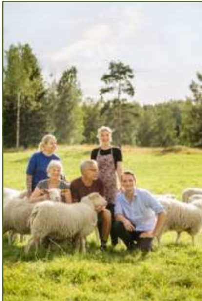
Bredsjö Mjölkfår utnämndes till Årets Fårföretagare 2020

Lokalföreningar och rasföreningar nominerar sina kandidater till utmärkelsen Årets Fårföretagare. Priset som Årets Fårföretagare 2020 tilldelades Bredsjö Mjölkfår i Bergslagen, som startade 1987 med sitt gårdsmejeri inriktat på mjölkfår och osttillverkning. Vilket har varit ett arbete i både med och motvind. Stort kunnande och känsla för marknaden har varit viktiga faktorer för att de skulle lyckats och nu är Bredsjö Blå välkänt över hela landet.