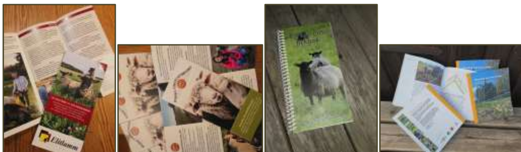
Delar av utbudet i "den lilla webshopen"

Under året 2020 har SF starta upp eget swishnummer för att förse medlemmar och ickemedlemmar med diverse trycksaker, till självkostandspris via SF egen lilla "webshop" på hemsidan.