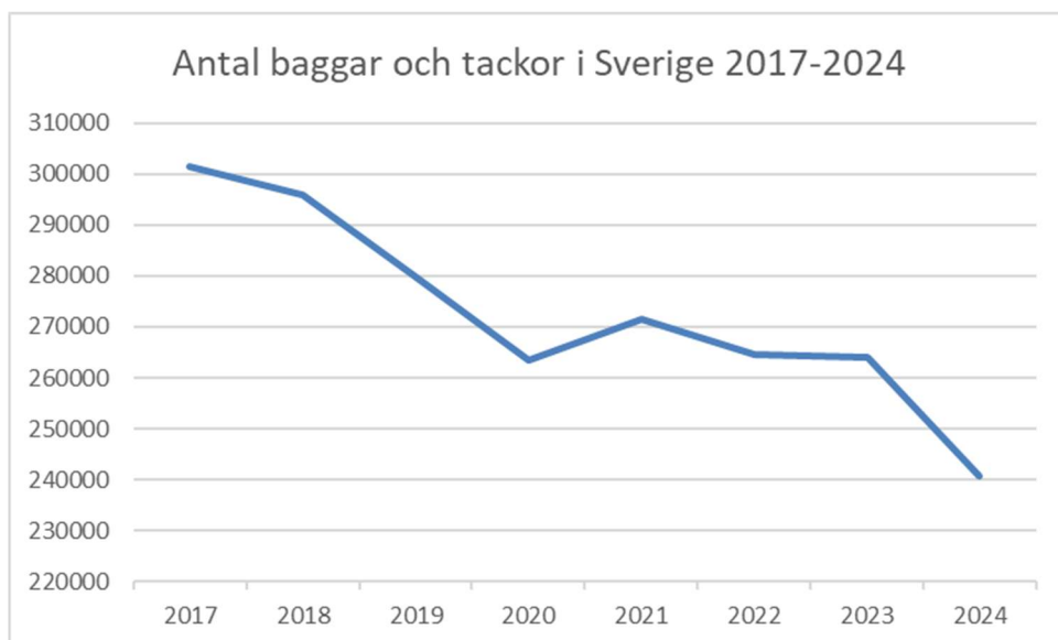
Figur 3. Antal tackor och baggar i Sverige 2017-2024. Källa: Jordbruksverkets statistikdatabas.