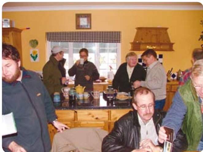
En värmande fika i Williams kök gjorde gott för det visade sig att vädret på Irland var rätt ruskigt trots allt.