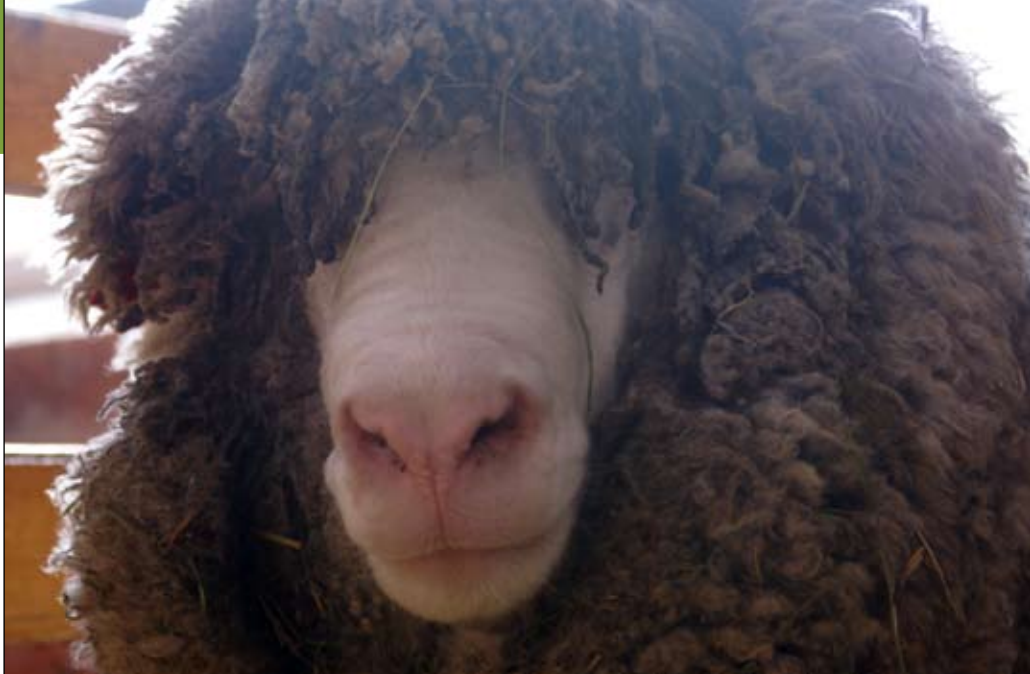
Den danska merinobaggen Ib är rankad som en av de bästa i Danmark med ett avelsindex på topp. Här före klippning.

-Jag och min kollega Lena deltog i ett ullmöte i Frankrike, med den franska ullorganisation A.T.E.L.I.E.R. Där fick vi se nya zeeländska får, en modernare typ av merino – en vitalare och veckfri variant som får många lamm och har fantastisk ull. De hade flugits över för ett år sen och vi fick se deras första avkommor. De hade korsat den nya zeeländska merinon med nordfransk merino och sydfransk merino. Och resultatet var spännande. Fåren hade en väldigt finfibrig ull. Det såg ut att vara tredubbelt så mycket som på en fransk merino. Den nya zeeländska merinon