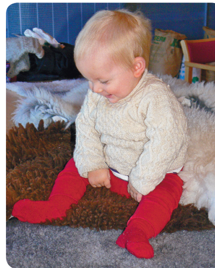
Skinn och ull roar både stora och små!