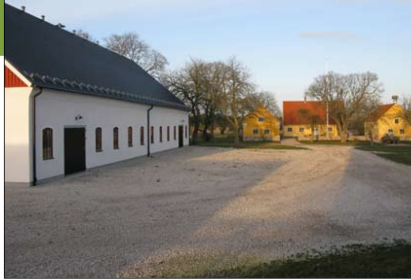
Fårhuset på Gane gård är byggt på samma plats och i samma stil som den gamla ladugården som stod där innan. Gårdsmiljön är genuint gotländsk.