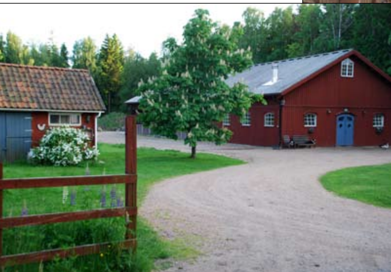
Eftersom många människor besöker Töllås fårgård är gårdsmiljön viktig. Det nya fårhuset smälter väl in i gårdsmiljön.

...korades ju i förra numret av Fårskötsel. Här tittar vi lite närmare på de vinnande fårhusen. Vi kommer att publicera alla insända bidrag i några nummer framöver.