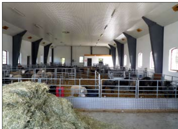
Här smids det planer för att effektivisera utfodringen. 100 tackor rymmer fårhuset.