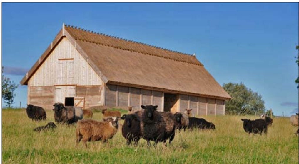
Helt fritt på en höjd ligger det fantastiska fårhuset i Bolum. Ingen möda har sparats för att göra det genuint och vackert.

Håkan och Ansi Andersson brukar Lilla Samuelsgården i Bolum, strax utanför Broddetorp. Alla husen på gården håller gammal stil med vasstak och ett i