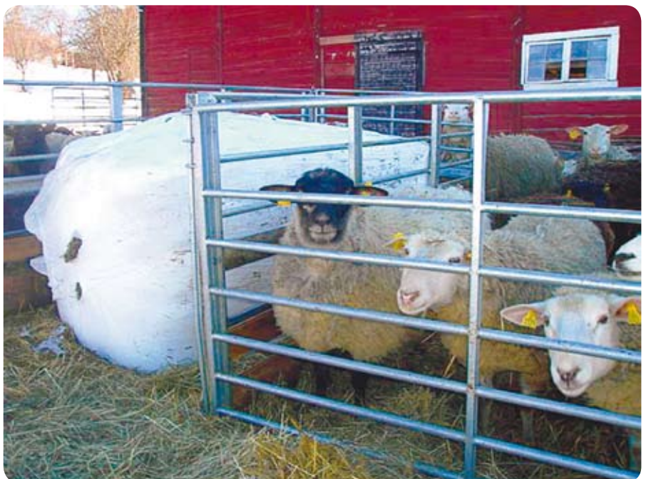
Det kan bli aktuellt för många att köpa grovfoder i vinter. Plastade fyrkantsbalar är det mest ekonomiska att transportera långt.