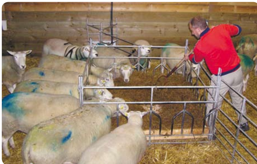
Räcker fodret till i vinter?