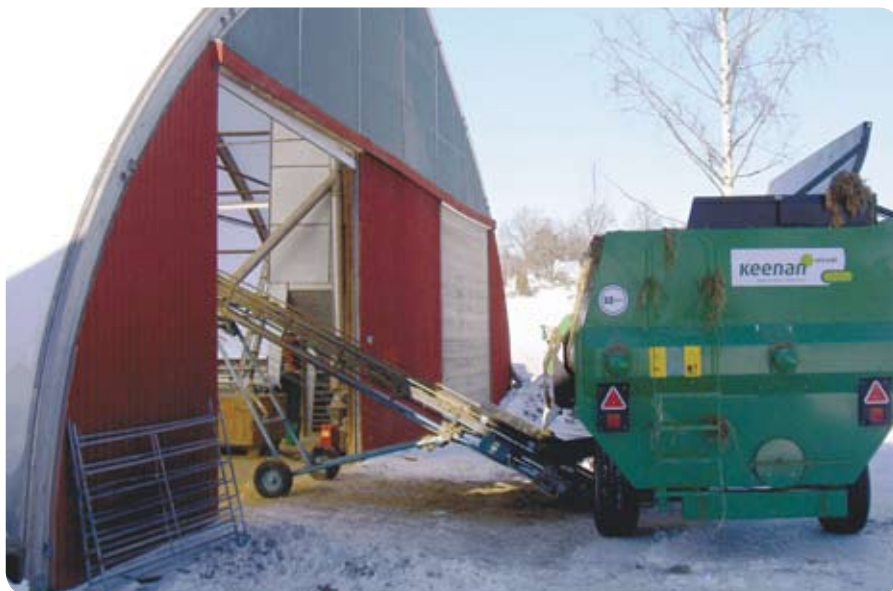
En mixervagn ger dig möjligheter att använda alternativa fodermedel på ett effektivt sätt.

Halm används inte som foder till tackor i någon större utsträckning i Sverige. Erfarenheterna är dock goda i andra länder. Halmen ska vara av god hygienisk kvalitet och passar bäst till sintackor och under lågdräktigheten även om det förekommer som enda grovfoder. Räkna foderstat och komplettera med kraftfoder, särskilt proteindelen och mineraler. Ammoniakbehandlad halm har diskuterats på många håll inför årets vinterfodersäsong. Kärnor som grott och för mycket grön massa i balarna ger stor risk för dödsfall om sådan halm behandlas med ammoniak. Antingen behandlar man rundbalar (minst 4 lager plast) var för sig eller en hel inplastad stack i taget (20 – 30 ton per stack). Behovet av kraftfoder ökar jämfört med när