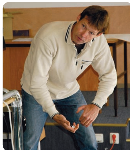
-Jag står grensle över tackan. Sedan för jag försiktigt svansen åt sidan med min vänstra hand samtidigt som jag har pistoletten redo i min högra hand.

Svensk Avel i Skara sköter den praktiska biten med lagring och distribution av sperman. Fårägarna anmäler när man vill ha sperman och får det hemskickat till sig. Det finns fungerande rutiner för detta, bland annat så sköter Svensk Avel mycket av den svenska seminverksamheten för hästar på