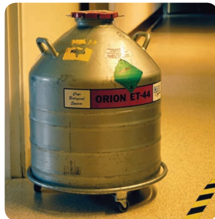
I detta kärl med flytande kväve ligger den engelska sperman och sover i väntan på att få göra nytta i de svenska tackorna. När detta läses har de flesta redan simmat klart!

- Jag vill påstå att det är ganska enkelt. Man bestämmer sig för att seminera under två eller tre dagar. Man gör en ordentlig brunstsynchronisering och sedan vet man