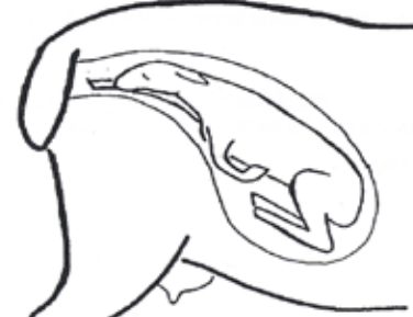
Ett framben ligger tillbakaslaget längs med fostrets kropp.