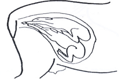
Twillingar som trängs i födelsekanalen samtidigt