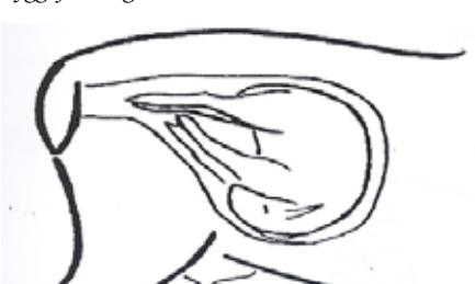
Alla fyra benen kilas in i födelsekanalen samtidigt.