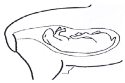
Lammet ligger upp och ner