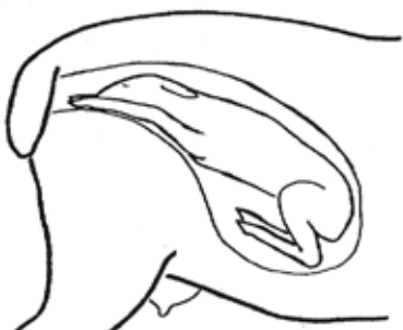
Normalt fosterläge. Huvudet och de sträckta frambenen kommer ut först. (Framdelsbjudning)

Exempel på fosterlägen, normala och fellägen.