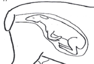
Båda frambenen ligger tillbakaslagna.