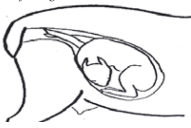
Huvudet är tillbakaslaget men frambenen är i normal position