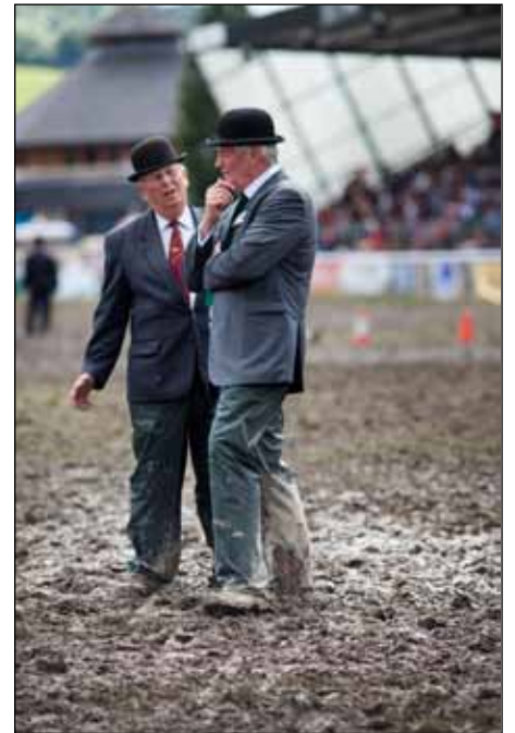
Det gäller att hålla stilen även i dåligt väder. Detta är huvudarenan efter två dagar och en del skyfall.

Tävlingsklippning är inte bara hastighet. De klippta fåren synas noga efteråt och alla skavanker ger minuspoäng. Det här lammet har blivit klippt i hälsenan och det ger naturligtvis straffpoäng.